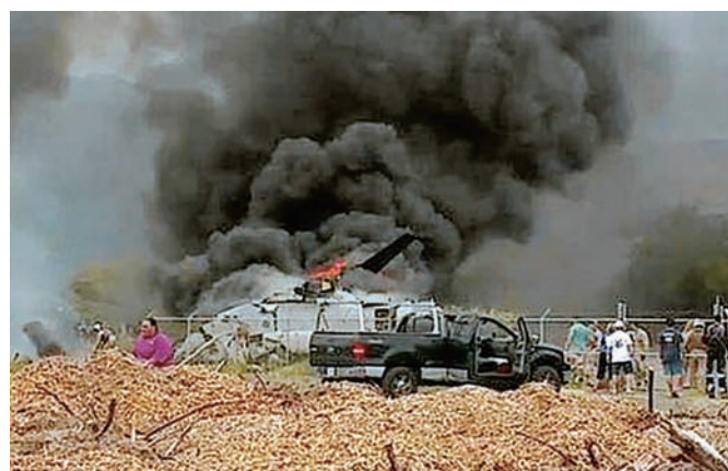
ハワイ米軍基地で着陸に失敗したオスプレイ

CV-22オスプレイが横田基地に配備されれば、ここを拠点として、基地周辺はもとより、東京から関東全域の上空で、夜間の低空飛行や急旋回など危険な訓練が常態化することは目に見えています。基地周辺には、学校や保育園、住宅などが数多くあり、横田基地への配備に、周辺自治体や住民はそろって抗議の声をあげています。危険にさらされるのは都民のいのちです。オスプレイ配備計画は、周辺住民だけの問題ではなく、都民全体のものとして配備計画を撤回させましょう。