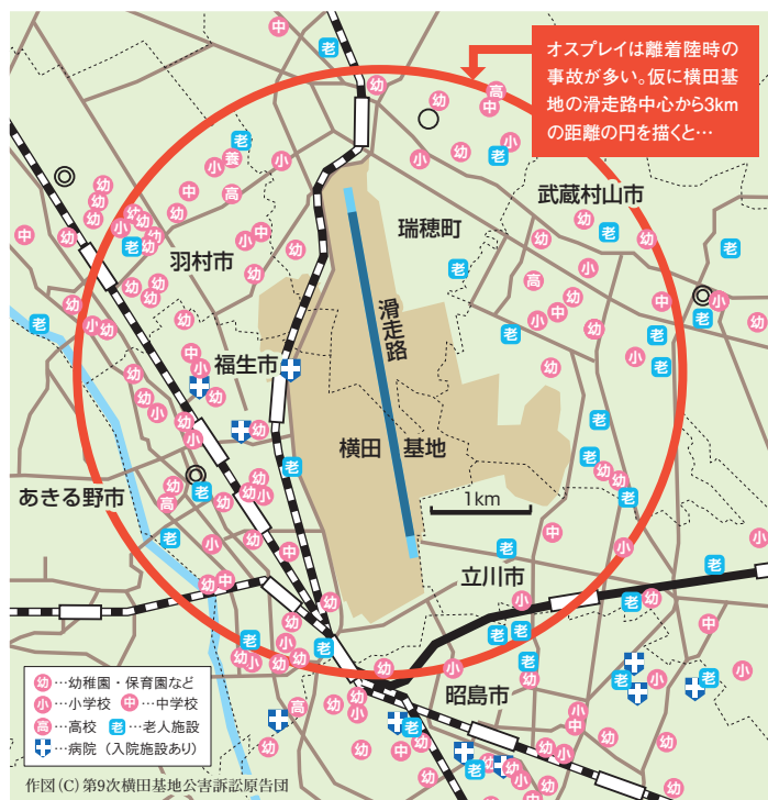
横田基地周辺の学校や老人施設、病院など(一部調査中)

私たちは、都民のいのちと安全を守るためにも、日本の平和を守るためにも、CV-22オスプレイの横田配備に反対し、その計画を撤回させる「オール東京」のたたかいをめざしています。安保法制=戦争法廃止をもとめるたたかい、沖縄の米軍新基地建設を許さないたたかいと連帯して、「11.21大集会」を大きく成功させ、オスプレイ配備撤回の世論を大きく広げていきたいと思います。多くの団体・個人のみなさんの集会への賛同と参加を心からよびかけます。