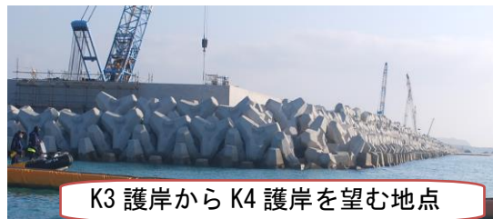
K3 護岸から K4 護岸を望む地点