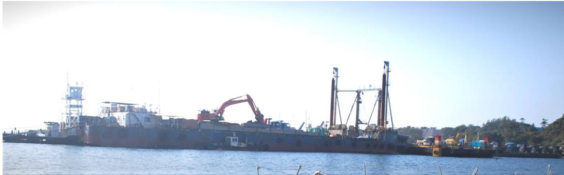
K9 護岸では台船から赤土を積み替える 10 数台のダンプが待機