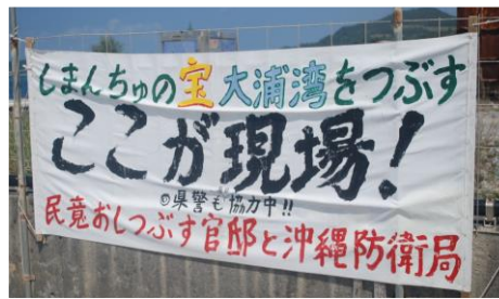
↑塩川港内の島ぐるみのバナー

本部町の塩川港と名護市安和の琉球セメント棧橋では、琉球セメントの鉱山から掘り崩した違法な赤土を輸送船へ積み込む作業が続いています。 塩川港で3月16日、台船五隻に土砂（1隻当たりタンク140台分、合計約700台分）が積み込まれました。沖合で台船から運搬船に積み替え、運搬船は一両日中大浦湾に運び、台船に積み替え、K8とK9護岸からダンクで辺野古側の海に埋め込めています。 この日、地元の島ぐるみなどの3人が監視と抗議活動を続けていました。その周辺には株式会社ケイの警備員がおおよそ100人態勢で警備に当たっています。抗議の女性は「私たちは3人なのに過剰警備です。辺野古新基地のための警備費は1日約2600万円使っているそうですが、この税金をコロナ対策に回すべきです」と話していました。