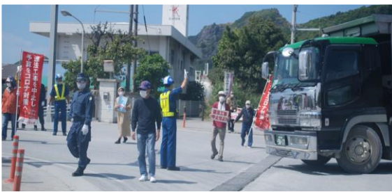
↑琉球セメント安和棧橋入口の抗議行動