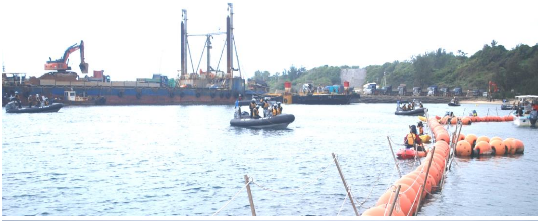
K9護岸付近の様子（護岸にはダンプの列。右端は抗議船・平和丸） K9護岸付近で監視活動する海上チーム