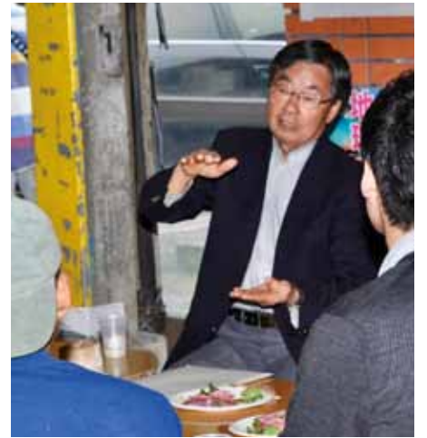
「夢語る夢フェス」で青年と

「辺野古新基地ができれば、これから200年も基地被害に苦しめられる。子や孫たちに、『おじい、おばあちは何をしていたの』と叱られないため、基地を止めると決めるのは私たちの大きな責任。子どもたちに自信をもって安心・平和の街を残そう」と、訴えました。